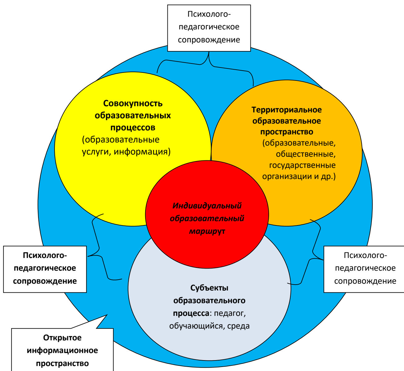
Рис. 1. Модель пространства персонального дополнительного образования МБУДО «РЦВР»